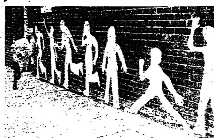
واكملت لعبة الظل في المواد الطلق